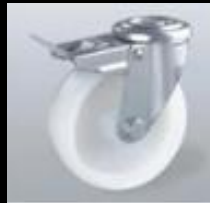
4 ruedas con freno