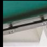
Rieles para accesorios